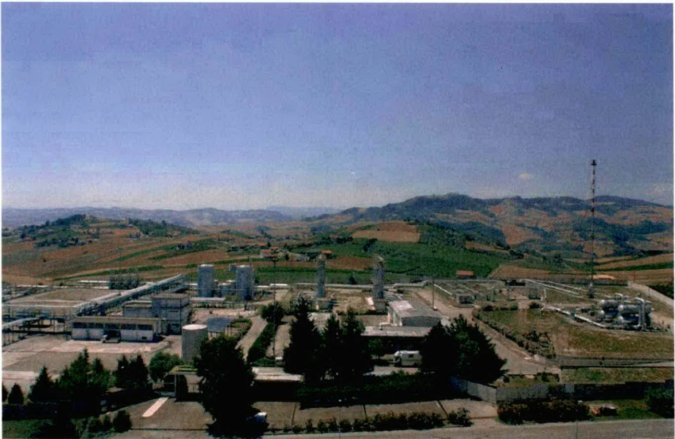
Centrale “Fiume Treste Stoccaggio”

Analisi del gas naturale nella centrale di stoccaggio “Fiume Treste Stoccaggio” della società STOGIT S.p.A., ubicata nel comune di Cupello (CH).