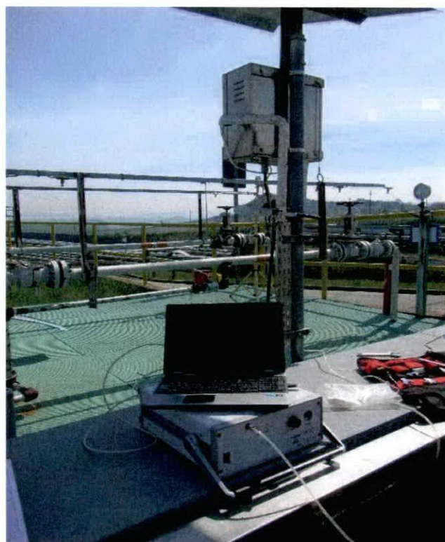
Foto 3 - Gascromatografo in misura

Sono stati effettuati sei campionamenti e analisi, dalle ore 12.00 alle ore 12.30; la media dei risultati ottenuti, espressi in percento in moli in condizioni standard ( T=15\text{ }^{\circ}\text{C} , P=101,325\text{ kPa} ), sono riportati nella tabella 1.